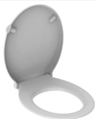
Figura di esempio